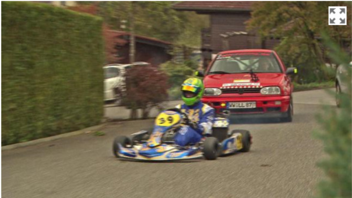
Schnell unterwegs: Einen Autoführerschein hat der junge Fahrer noch nicht...