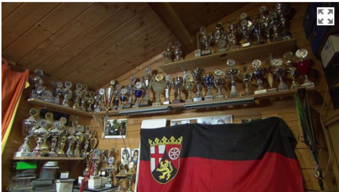
... dafür aber schon eine ordentliche Pokalsammlung im Regal.